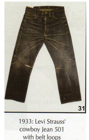
1933: Levi Strauss' cowboy Jean 501 with belt loops

Le contenu se veut historique mais pas trop , anecdotique mais pas trop , chimique mais pas trop , technologique mais pas trop, sociétal mais pas trop !